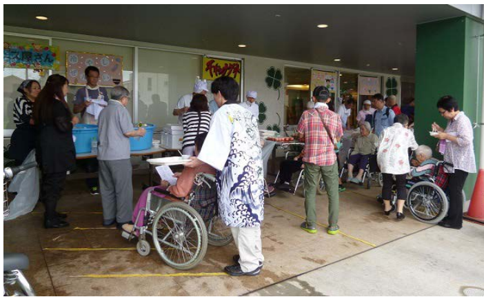
屋台は今年也大盛況!! 鮭のちゃんちゃん焼き、チキンナゲット、わたあめ、白玉ぜんざいと盛りだくさんのメニューでし