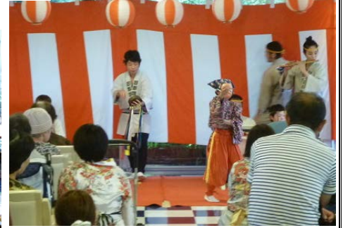
日野御囃子保存会のみなさま♪