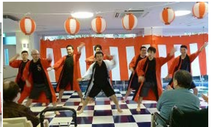
職員による大迫力のソーラン節!!